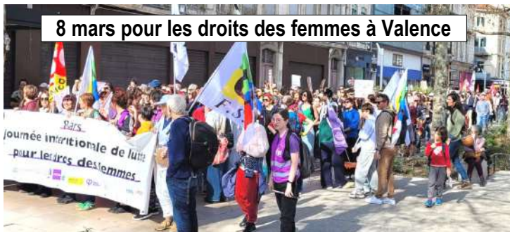
8 mars pour les droits des femmes à Valence