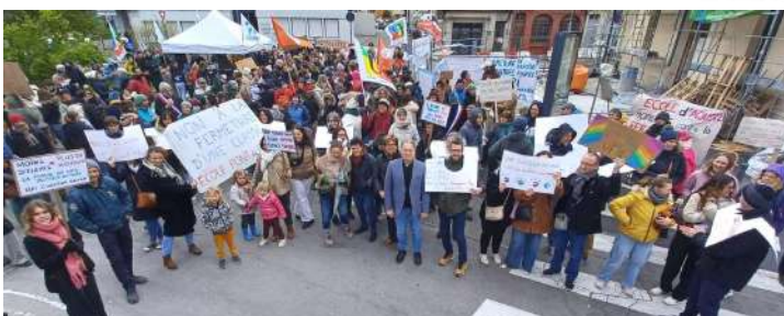
Le 26/03 à Valence contre les fermetures de classes