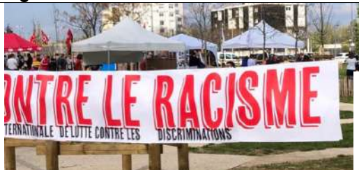
Village contre le racisme à Valence le 21 mars