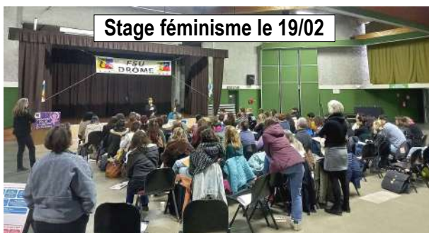
Stage féminisme le 19/02