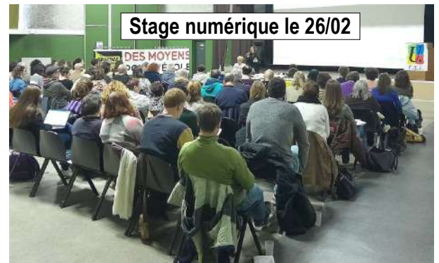
Stage numérique le 26/02