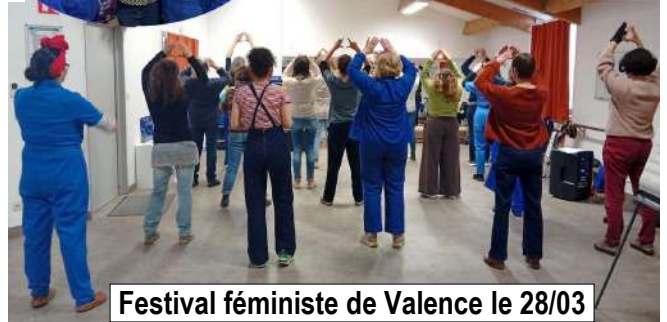
Festival féministe de Valence le 28/03