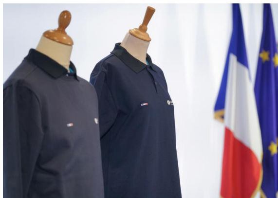
Présentation de l'uniforme des lycéens pour la rentrée 2024

La chambre a relevé que, dans le cadre d'une expérimentation sur le port de l'uniforme dans les lycées, la région a commandé les uniformes via son marché d'achat d'objets promotionnels, dont ce n'est pas l'objet, sauf à considérer que les uniformes scolaires portés par les lycéens soient avant tout des objets promotionnels pour la région. La chambre formule également des observations sur le fonctionnement des deux marchés d'achats « médias » avec un mandataire-payeur, qui permet indument à la région de contourner ses obligations de mise en concurrence.