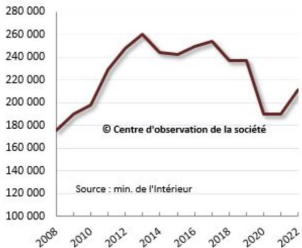
Nombre de cambriolages selon la police et la gendarmerie