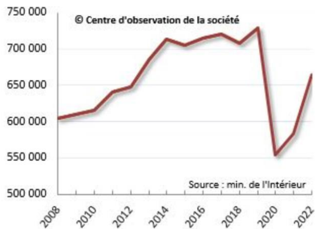
Nombre de vols sans violence contre les personnes selon la police et la gendarmerie