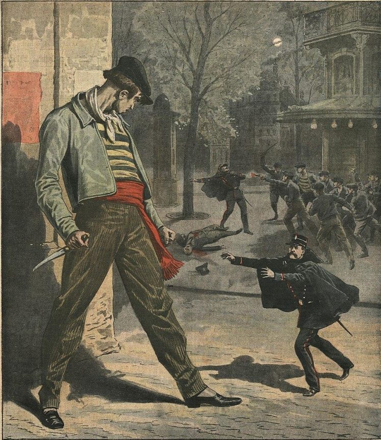
L'APACHE EST LA PLAIE DE PARIS Plus de 30,000 rôdeurs contre 8,000 sergents de ville

Le Petit Journal 5 CENTIMES SUPPLEMENT ILLUSTRÉ 5 CENTIMES ABONNEMENTS CHACUN JOUR - 6 PAGES - 5 CENTIMES Administration : 61, rue Lafayette Le Petit Journal Militaire, Maritime, Colonial . . . 10 cent. Le Petit Journal agricole, 5 cent. ~ La Mode du Petit Journal, 10 cent. Le Petit Journal illustré de la Jeunesse, 10 cent. CHACUN SEMAINE 5 CENTIMES On s'abonne sans frais dans tous les bureaux de poste Les manuscrits ne sont pas rendus Dix huitième Année DIMANCHE 20 OCTOBRE 1907 Numéro 683