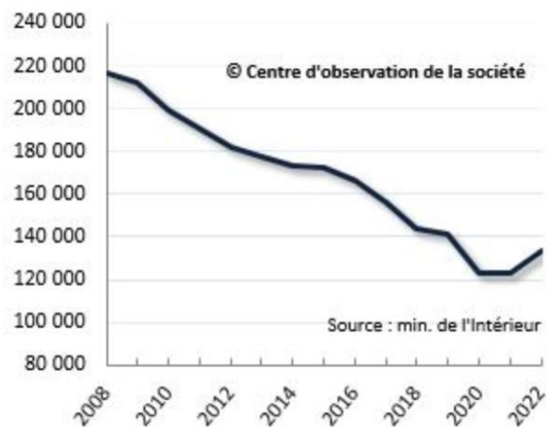
Nombre de véhicules volés selon la police et la gendarmerie