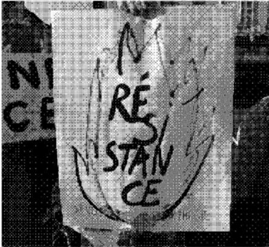
contre-manifestation à la venue de Marion Marchal Le Pen, 4 avril 2024