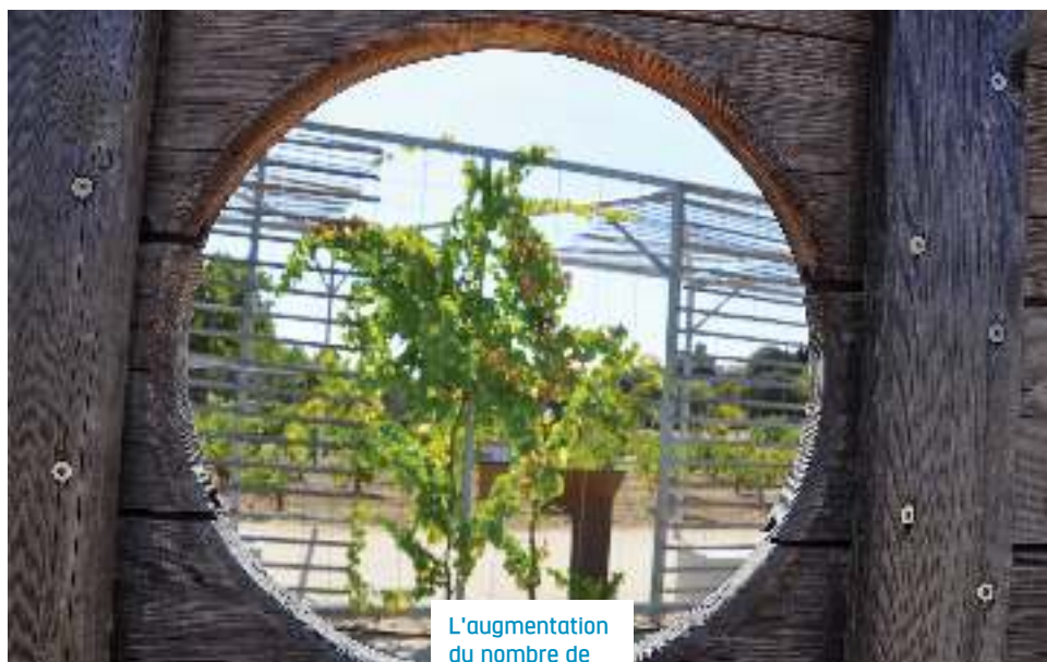
L'augmentation du nombre de semaines passées en milieu professionnel ne pourra se faire qu'au détriment de la culture et de l'enseignement général.

La réforme annoncée devrait se traduire par un rapprochement du lycée professionnel avec le monde de l'entreprise, notamment une augmentation de 50 % du nombre de semaines de stages, soit le tiers du temps dans les formations professionnelles relevant de l'enseignement agricole. L'enseignement agricole public, dont près de 45 % des élèves suivent un baccalauréat professionnel, est directement concerné par le décret de création du diplôme. Répondre aux besoins des territoires, à ceux des professions, l'enseignement professionnel agricole le fait déjà. Il assure également une mission d'animation des territoires par ses établissements. Il répond aux besoins de formation des entreprises notamment par ses centres de formation professionnelle et de promotion agricole (CFPPA). Mais il ne peut être réduit à cela. Le risque serait de sacrifier un volet essentiel de la voie professionnelle scolaire, à savoir l'émancipation et la formation citoyenne des élèves, et aussi, par conséquence la poursuite d'études.